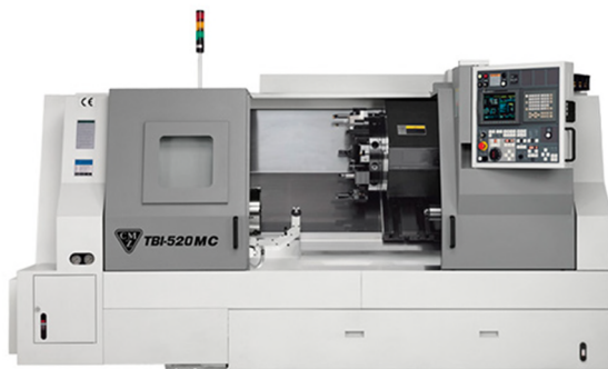
Torno Control Numérico CMZ: diámetro máximo 320 x 1.000mm de largo