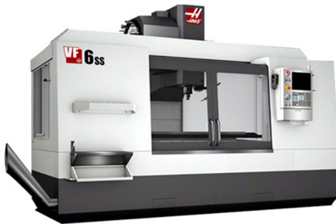
Centro Mecanizado HAAS: de 4 ejes de 1.600mm x 880mm x 800mm