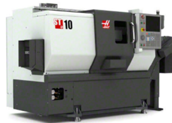
Torno Control Numérico HAAS: diámetro máximo 320 x 400mm de largo