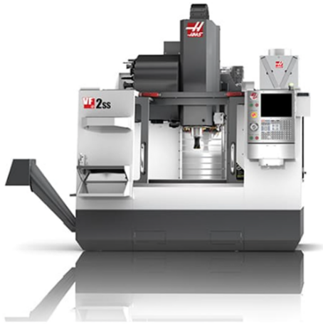
Centro Mecanizado HAAS: