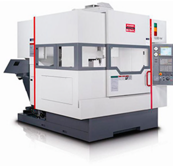
Centro Mecanizado Quaser: de 3 ejes de 700mm x 500mm x 500mm